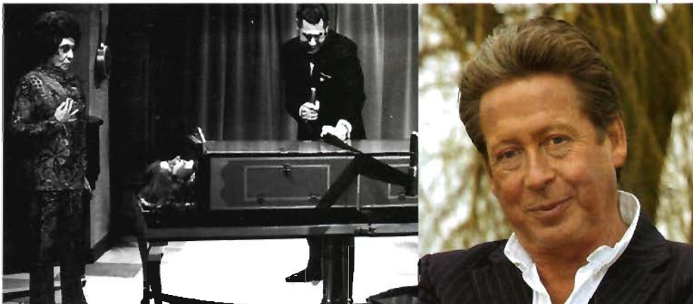
Meestergoochelaar Fred Kaps zaagt een meisje door

De wereldkampioenschappen worden nog steeds elke drie jaar gehouden. De presidenten van de overkoepelende goochelorganen per deelnemend land stemmen over de locatie. In de zomer van 2009 heeft de 24ste editie plaats in China. Tijdens het WK worden er prijzen uitgelooft in verschillende categorieën, onder meer manipulatie, kaartspellen en komedie. De hoofdprijs is de Grand Prix, die Nederland tienmaal in de wacht heeft gesleept. Bijna de helft van de wereldkampioenen is dus van Hollandse bodem.