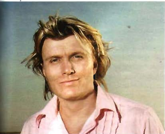
Hans Klok trad maandenlang op in Las Vegas

Lid worden van een goochelvereniging kan iedereen. Dus schuilt in iedereen ook de nieuwe Hans Kazan? Waarschijnlijk niet. Fred Kaps zei het al: 'Je hebt mensen die